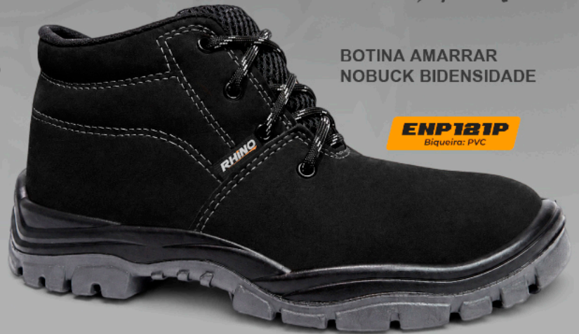
BOTINA AMARRAR NOBUCK BIDENSIDADE

Desfrute do melhor em estilo, conforto e durabilidade com nossa linha de calçado 100% couro nobuck. Feita para resistir ao tempo e elevar seu estilo, cada passo é uma experiência de conforto incomparável. Aproveite o melhor do design e da qualidade em cada momento.