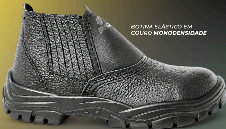
BOTINA ELÁSTICO EM COURO MONODENSIDADE