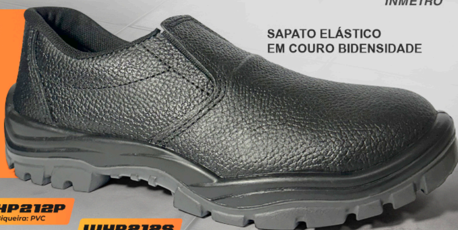
SAPATO ELÁSTICO EM COURO BIDENSIDADE

Descubra a combinação perfeita de segurança e conforto com nossa linha de calçados de segurança em couro. A durabilidade do couro se une à tecnologia do solado bidensidade, oferecendo proteção superior e conforto prolongado para o seu dia de trabalho.