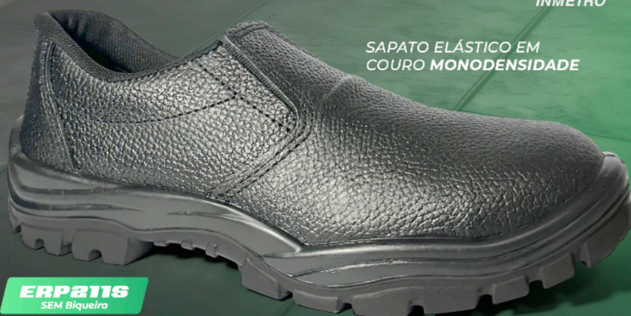
SAPATO ELÁSTICO EM COURO MONODENSIDADE

A linha de calçados de segurança em couro com solado monodensidade oferece a combinação ideal de proteção, conforto e durabilidade para o seu dia a dia de trabalho.