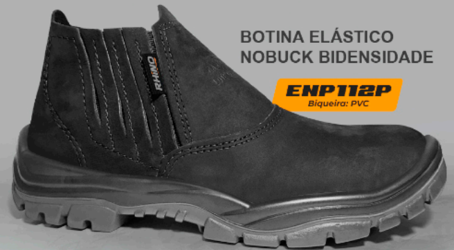
BOTINA ELÁSTICO NOBUCK BIDENSIDADE