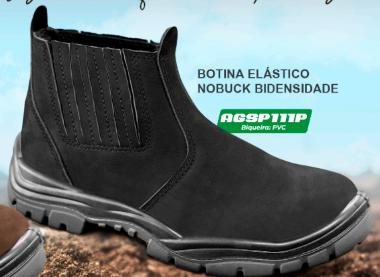
BOTINA ELÁSTICO NOBUCK BIDENSIDADE