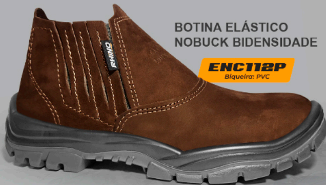
BOTINA ELÁSTICO NOBUCK BIDENSIDADE