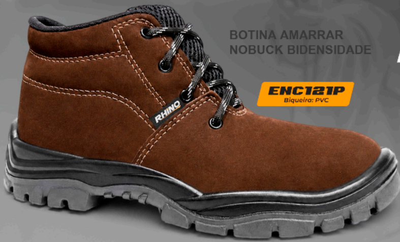
BOTINA AMARRAR NOBUCK BIDENSIDADE