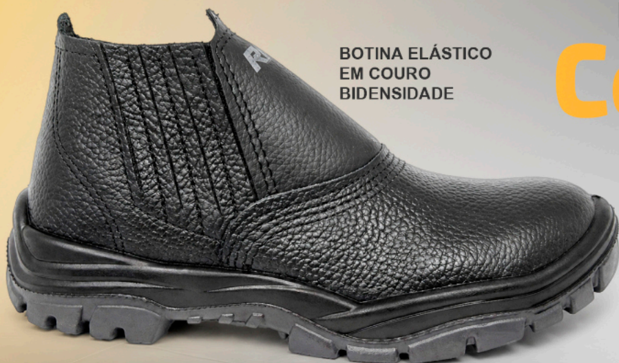
BOTINA ELÁSTICO EM COURO BIDENSIDADE