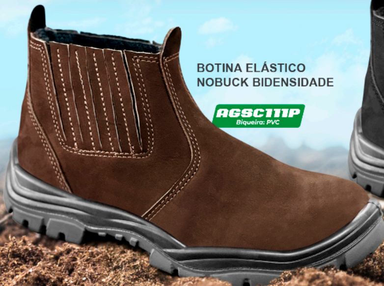
BOTINA ELÁSTICO NOBUCK BIDENSIDADE